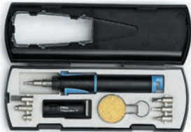
Газовый набор ProfiSet-75 (0G07400141)

Плавная регулировка мощности от 15 до 75 Вт Работает на газе (бутане). Паяльник может работать на одной заправке до 60 минут. Максимальная температура пайки может достигать 580°C. Время разогрева 46 сек. В комплекте паяльник Independent 75 (0G070KN), 8 наконечников серии G072, защитный колпачок, контейнер с чистящей губкой, футляр для набора