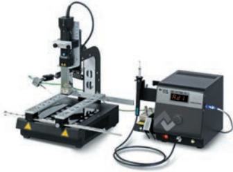
Ремонтная система HR100 с опциональными аксессуарами