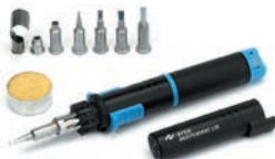
Газовый набор ProfiSet-130 (0G13400141)

Плавная регулировка мощности от 15 до 75 Вт Работает на газе (бутане). Паяльник может работать на одной заправке до 60 минут. Максимальная температура пайки может достигать 580°C. Время разогрева 46 сек. В комплекте паяльник Independent 75 (0G070KN), 8 наконечников серии G072, защитный колпачок, контейнер с чистящей губкой, футляр для набора