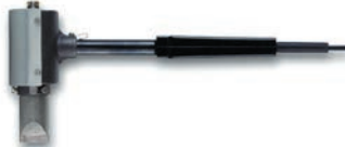
Паяльник ERSA550 (0550MZ)

Паяльник-молот, особенно подходит для обработки листового металла, монтажных работ, а также для пайки коллекторов и медных шин, также полезен в ремонте кузова автомобиля и свинцовом остеклении. В комплекте с никелированным жалом 0302MZ и держателем 0A17. Мощность 300 Вт. Вес 1490 г. нагрев за 300 сек.