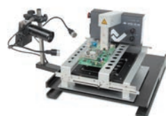
HR200 (0HR200) с Reflow Process Camera (0VSRPC500-LE)