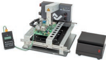
Ремонтная система HR200 с опциональными аксессуарами