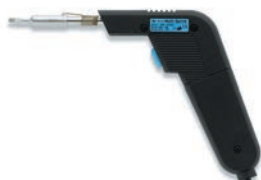
Паяльник Multi-Sprint 220В, 75Вт (0960ED)

Паяльник импульсный с малоинерционным нагревателем; нагрев при нажатии кнопки на ручке; вес 100г; макс. мощность 75Вт; конструкционно совместим с сериями жал и насадок 832/842/852; легкая эргономичная рукоятка; термоустойчивый шнур; долговечное жало 832ED; удобен для распайки кабелей, а также для любых "быстрых" работ, не требующих стабильной температуры паяльника