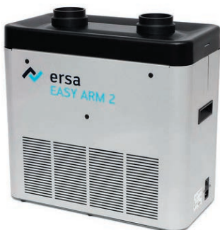
Агрегат локальной воздухоочистки EasyArm 2 (OCA10-002) Габариты, мм 255*490*470

Антистатические высокоэффективные и компактные установки дымоудаления для одного и двух рабочих мест.