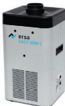
Агрегат локальной воздухоочистки EasyArm 1 (OCA10-001) Габариты, мм 255*255*470

Вытяжка бесшумная и эффективная. Мощность вытяжки плавно регулируется. Эффективная 3-ступенчатая фильтрующая система - степень фильтрации 99,95%, расход воздуха 110 м 3 /ч на одно рабочее место.