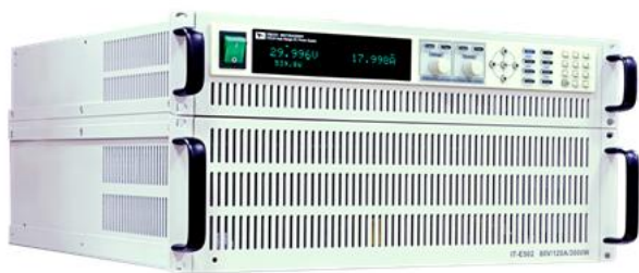
Источник АКІП-1148А-80-120 (сверху) с опц. блоком поглощения мощности ИТ-Е502 (снизу)