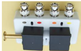
Адаптер подключения 1012 (1014)

* Примечание: при установке переключателя в положения А или В - опции могут быть использованы с измерителями RLC и анализаторами компонентов WK в соответствии с нижеуказанной таблицей совместимости: